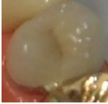
(金属にセラミックを 焼き付けたもの)