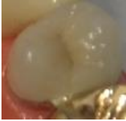
(金属にセラミックを焼き付けたもの)